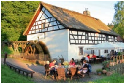
Theley, Johann Adams Mühle