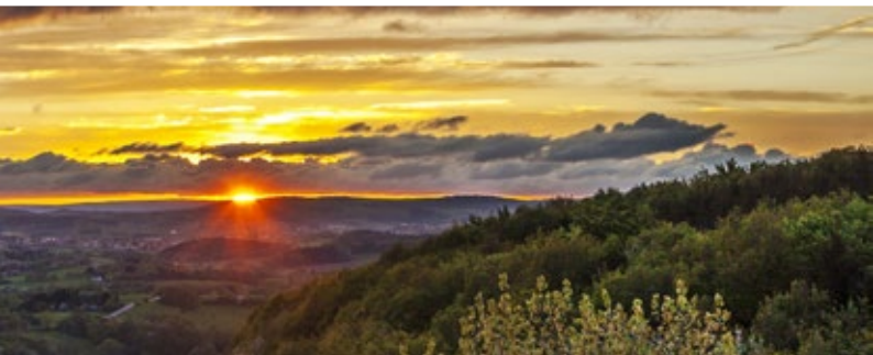
Sankt Wendeler Land mit Schaumberg