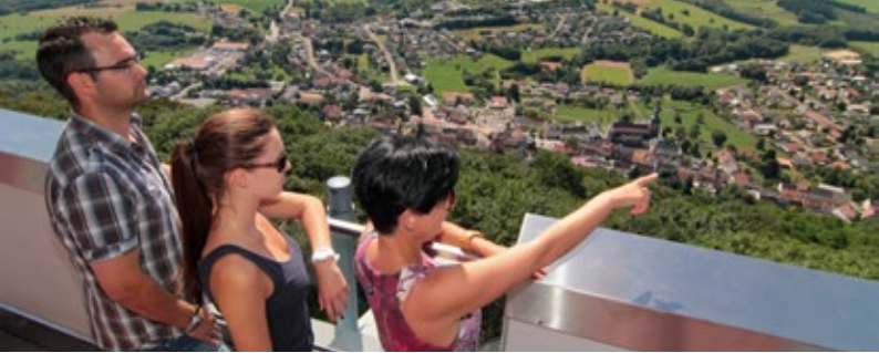
Tholey, Blick vom Schaumbergturm