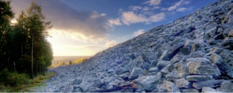
Hunnenring - Ringwall der Kelten