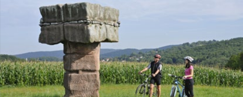
Straße der Skulpturen