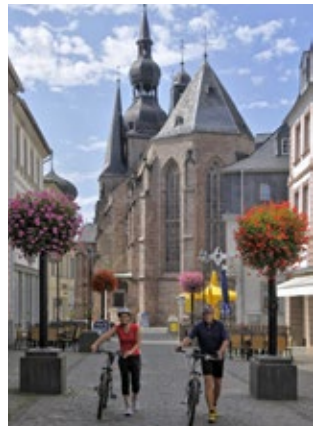
St. Wendel, Wendelinus-Basilika